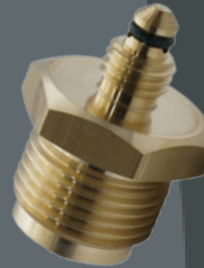
Adapter Model 34