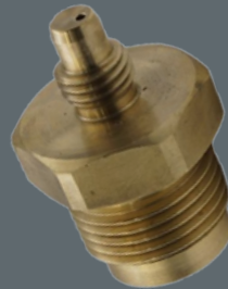
Adapter Model 41

** QF: 0,56 kg / long 0,67 kg 440 mm / long 550 mm